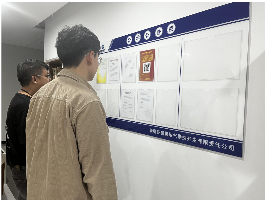
图 3.2-5 现场公示照片