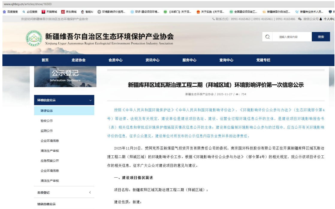
图 2.2-1 第一次网络公示